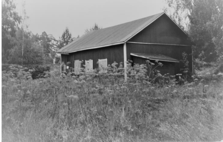
Kilpiäisten VPK:n vanha kalustovaja

Merkittävän ja ikävin tapahtuma palon tiimoilta sattui kuitenkin suojeltaessa Mukkulan kartanon latoa palolta. Lato sijaitsi aivan Niemen sahan lähellä. Kartanon poika juoksi palopaikalle ja kiipesi ladon katolle estämään tulen leviämistä. Poika sai heti kohta tultuaan sairaskohtauksen ja menehtyi sairaalaan vietäessä.